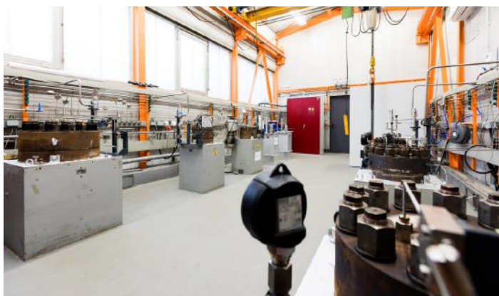
Versuchsaufbau für CO 2 -Korrosionsversuche (rotierender Käfig) und Autoklaven-Labor bei der Salzgitter Mannesmann Forschung GmbH

In Korrosionsversuchen konnten die Mannesmann CO2ready®-Rohre hinsichtlich Sicherheit und Zuverlässigkeit auf ganzer Linie überzeugen. Selbst ein kurzzeitiges Auftreten von freiem Wasser ist kein Problem, solange der Gehalt von säureproduzierendem Stickstoffdioxid und Schwefeldioxid oder von wasserstoffinduzierte Korrosionsmechanismen auslösender Schwefelwasserstoff nur in Spuren im Gas enthalten ist.